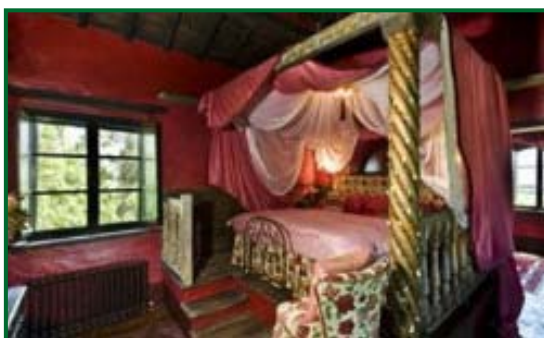
La Lupaia – Agriturismo, camere Torrita di Siena, Siena.

Prezzo: appartamento per due persone da 85€.