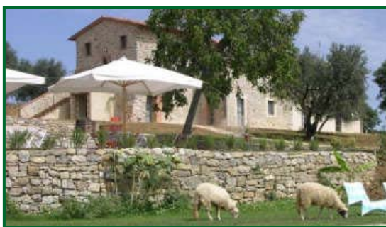
Podere Le Olle – Agriturismo, camere Montegabbione, Terni.

25 gennaio 2010. Lo studio commissionato da Toprural : " Radiografia del Turista Rurale 2009 - italia " evidenzia come il 56% dei turisti rurali italiani preferisca una vacanza in agriturismo romantica in compagnia del proprio compagno o della propria compagna. In occasione del 14 febbraio, la festa degli innamorati, Toprural propone una selezione di agriturismi in Italia Francia e Spagna dove passare un fine settimana all'insegna dell'amore.