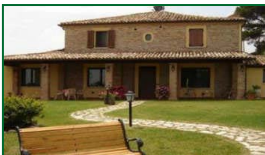
Papaveri e Papere – Agriturismo, appartamenti Saludecio, Rimini.

Prezzo: camera per due persone/notte con colazione €68.